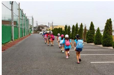
ワクワクした顔で来場