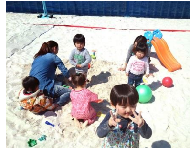
子どもたちは夢中で遊びます