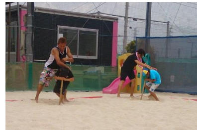
クルクル回ってさらに大変