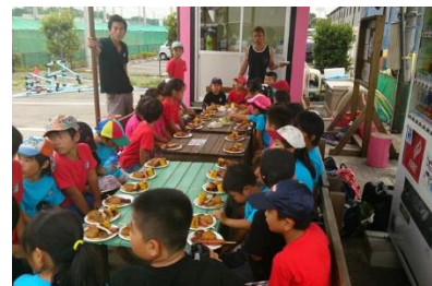
みんなそろっていただきます！