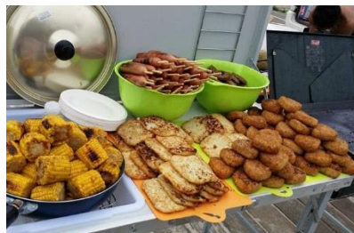
ランチはその場で調理