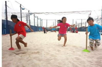
ビーチフラッグス