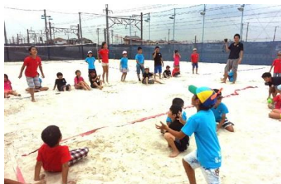
ヨーヨー投げで勝負